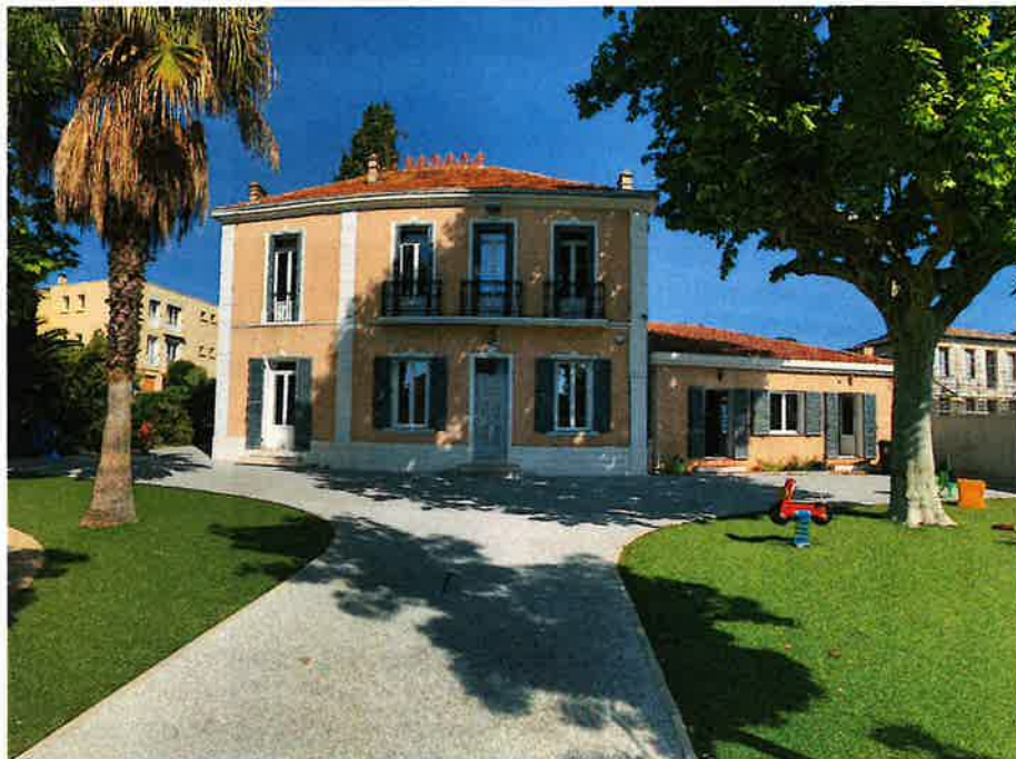
Bâtisse principale de l'ACMSH GRAC

L'accueil à l'ACMSH GRAC peut être également organisé dans les établissements suivants :